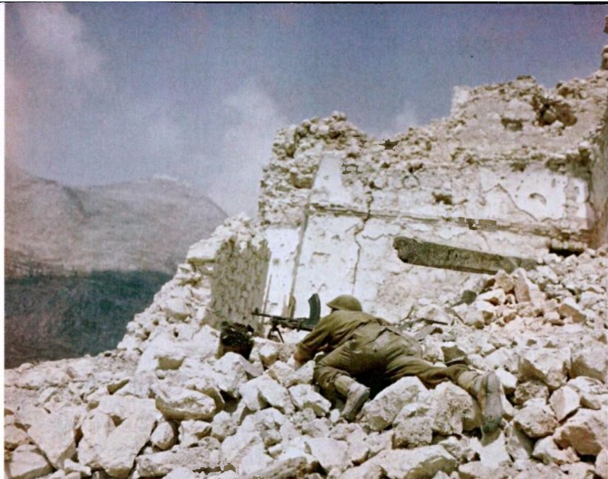
הפצצות לא הספיקו. חייל בריטי בהריסות מונטה קאסינו באיטליה