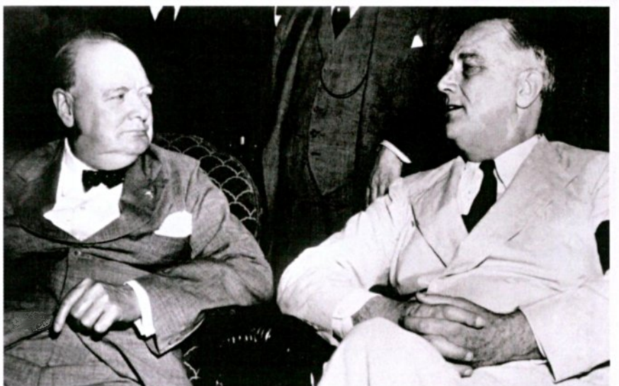
התנייס בקושי. רוזוולט וצ'רצ'יל

טראמפ יכריז על ניצחון ודי בצדק. וגם האיראנים מצידם יכריזו על ניצחון משום שהם שרדו את המערכה. מכיוון שמדובר במשטר טוטליטרי הוא יכול להכריז מה שהוא רוצה, שכן אין שם עיתונות חופשית והרשת חסומה לחלוטין."