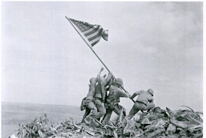
תמונת ניצחון. הנפת הדגל באיוו ג'ימה