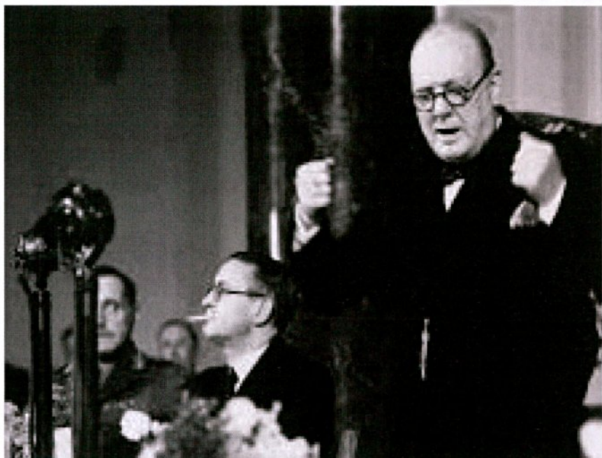
"דם יזע ודמעות". צ'רצ'יל נואם לאומה

והוא ממשיך למלא תפקיד מכריע דומה גם כיום. גרמניה הנאצית פעלה באופן מובהק מתוך תפיסה של כיבוש משאבים: היא כבשה את נורבגיה ודנמרק כדי להבטיח את נתיבי השיט להובלת ברזל משוודיה לתעשיית הנשק שלה, פעלה לשליטה בשדות הנפט ברומניה, השתלטה על אסם התבואה האוקראיני ואף ניסתה להגיע למאגרי הנפט העצומים בקווקז.