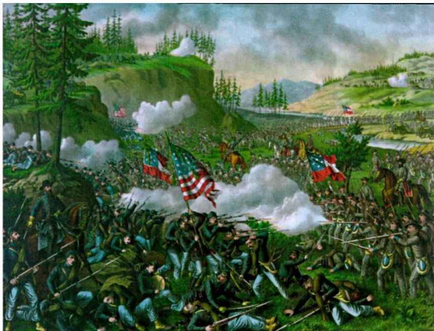
אדמה חרוכה. מלחמת האזרחים האמריקאית

"כאן בדיוק באה לידי ביטוי גדולתו ההיסטורית של צ'רצ'יל. באמצעות רטוריקה