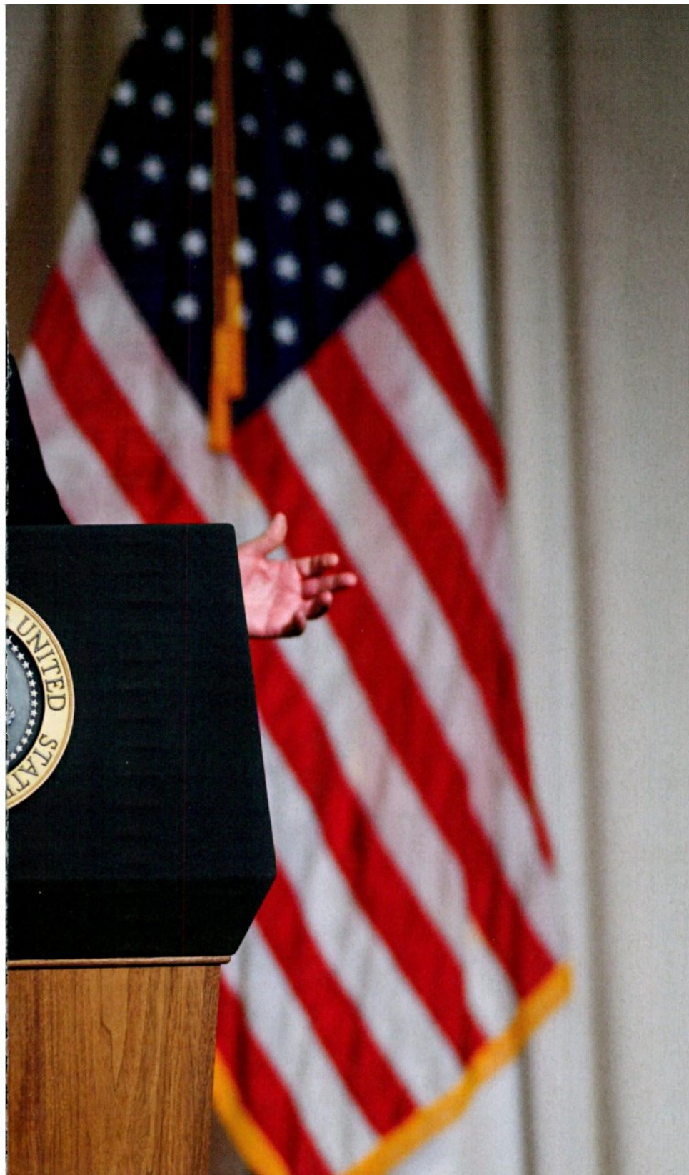
האיש הקובע באמת. נשיא ארצות הברית במסיבת עיתונאים, השבוע

חת המסקנות הכואבות מהמערכה הממושכת שמנהלת ישראל מאז שמחת תורה תשפ"ד היא שלמרות ההישגים המרשימים בשדה הקרב בשלוש חזיתות הלחימה, עדיין קשה להכריז על הכרעה ועל ניצחון מוחלט מול אויבינו. תסכול זה בולט במיוחד בחזית האיראנית, שאמנם ספגה מכות אנושות בשני מבצעים מזהירים שערערו באופן דרמטי את משטר הרשע, אך לא הביאו עד כה לכניעתו או לקריסתו.