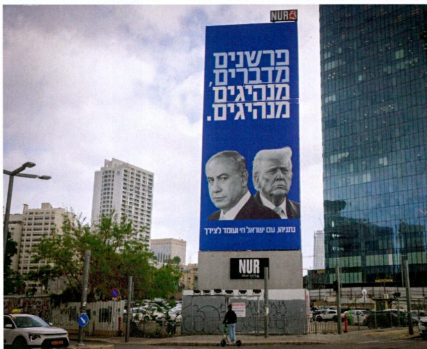
שני מנהיגים, אחד קובע. טראמפ ונתניהו