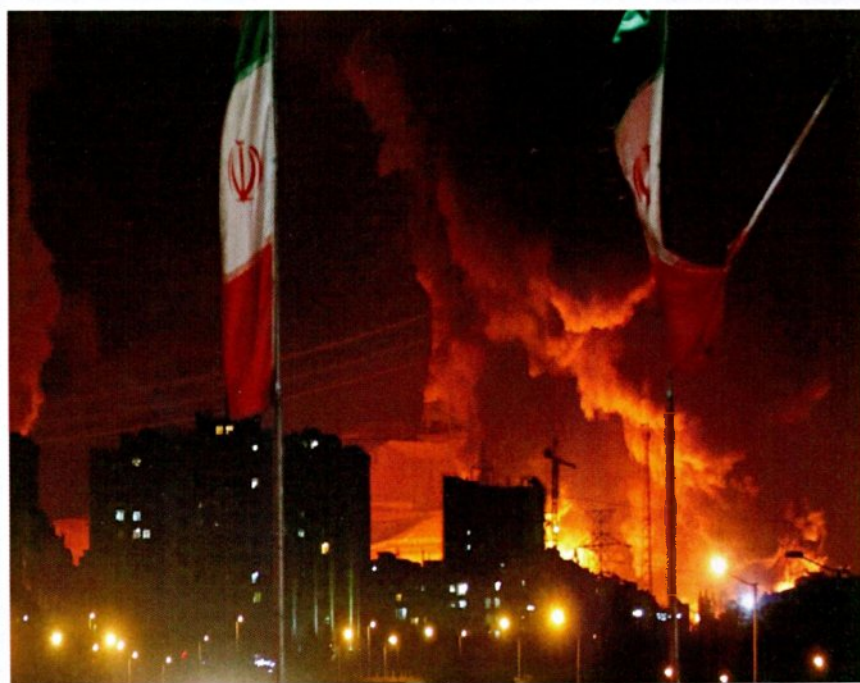
הקריסה תגיע מתישהו. ההפצות באיראן