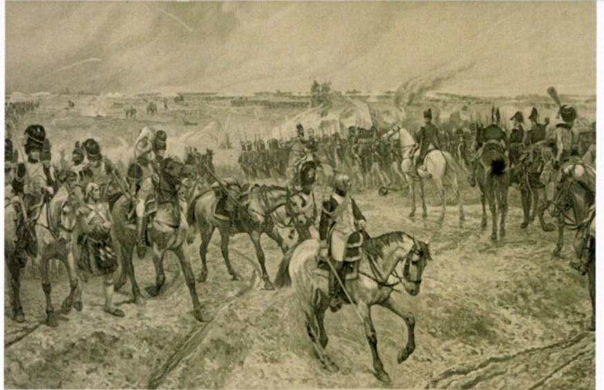
ניצחון באמצעות קואליציה. מלחמת קרים

"כך קרה גם בוועידת קזבלנקה בחורף של שנת תש"ג (1943), כאשר הוחלט על דרישה לכניעה ללא תנאי. המהלך נעשה תוך תיאום הדוק