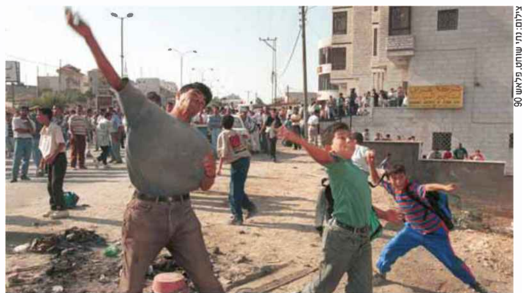
צילום: חני שוחט, פילאט, 90

"שעות על גבי שעות. הוא כל הזמן שאל על המקומות שהוא היה בהם. הבאתי לו תמונות משם והיו לו דמעות בעיניים. זאת הייתה תחושה בלתי רגילה. אני הרי גדלתי על הסיפורים של אבי מביירות, ועכשיו חייתי אותם. בפעם