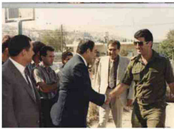
רקורד צבאי שיכול למלא ספר בפני עצמו. משמאל למעלה, עם כיוון השעון: אלעד בחדר מצב משותף עם הרש"פ 1996; בטקס חג המולד כמושל בית לחם; כמושל ג'נין בפגישה עם בכירי העיר; במהלך סיור בתפקיד מושל בית לחם

היום? אני עבדתי במוסד שמואל נאמן, ובמהלך התקופה הזאת עשיתי טעות. כתבתי מאמר שבו טענתי שכן גוריון צדק במהלך הזה. פרופ' תדמור, נשיא המוסד שבעברו היה נשיא הטכניון, זעם עליי בעקבות המאמר. הוא אמר לי שאם הייתי מראה לו את המאמר הזה לפני שפרסמתי אותו הוא לא היה מאשר לי לפרסם. באקדמיה, בייחוד בעולמות המחקר, כן גוריון הוא מישוהו שאסור להזכיר את שמו. אבל יש מציאות, והיא מוכיחה שהוא צדק. אנחנו הסטארט אפ ניישן, זה מאוד בולט לעין שכל ההצלחות הללו התחילו אצל יוצאי מערכות הביטחון. בין אם זה התעשייה הצבאית ובין אם זה 8200. אבל בשביל האקדמאים העתיקים זה היה מעשה נפשו. העובדה שהוא הוכיח את עצמו לא משנה להם כלל. בסוף ישראל הצעירה הייתה צריכה לפעול לפי סדרי עדיפויות כואבים עם האמצעים המוגבלים שהיו לה וזה מה שהיא עשתה. שם התקבעה התפיסה הישראלית שמערכת הביטחון חייבת להיות במרכז. אתה רואה את זה גם היום."